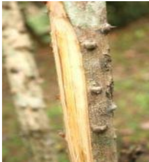
Gambar 2.1 Batang Kayu Secang

Secang ( Biancheae sappan (L.) Tod. ) adalah tanaman perdu atau berkayu yang pertama kali ditemukan oleh Kimichi di Brazil dan dikenal dengan nama Brazil wood. Beberapa sumber menyebutkan bahwa tanaman ini berasal dari India, kemudian menyebar ke Burma, Thailand, Indo China, Malaysia, Indonesia, Filipina, Sri Lanka, Taiwan, dan Hawaii. Kayu secang dapat diolah dan dimanfaatkan untuk berbagai macam hal yang memiliki manfaat yang baik bagi kesehatan, sebagai pewarna alami, yaitu karena adanya senyawa utama berupa brazilin, yang memberikan warna merah pada kayu secang (Sari dan Suhartati et al. , 2016). kayu secang ( Biancheae sappan (L.) Tod. ) dapat dilihat pada gambar 2.1