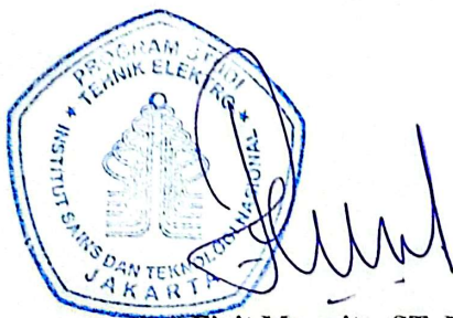
Fivit Marwita, ST. MT