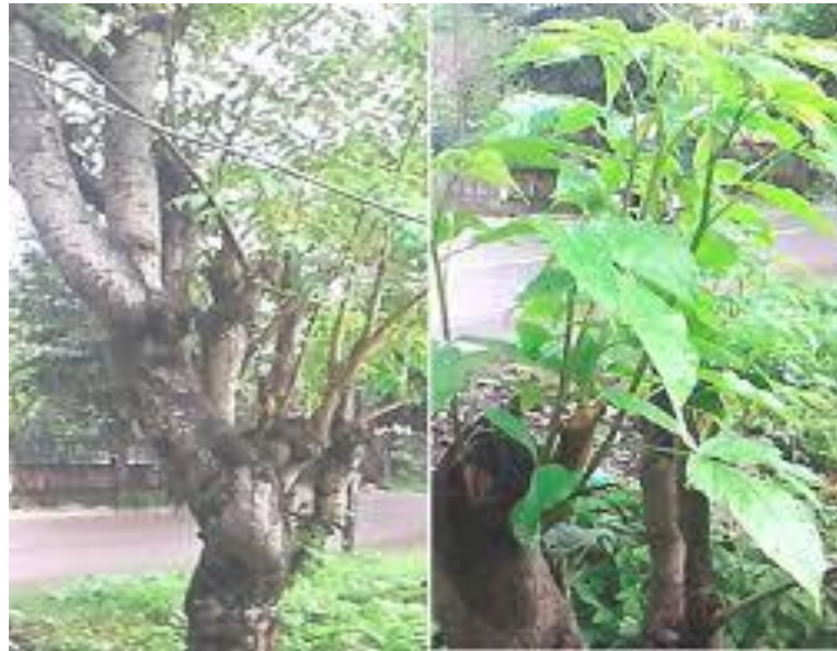
Gambar 2.1 Tanaman Kayu Jawa

Kerajaan : Plantae Filum : Magnoliophyta Kelas : Spermatophyta Bangsa : Sapindales Suku : Anacardiaceae Marga : Lannea Jenis : Lannea coromandelica [Houtt.] Merr.